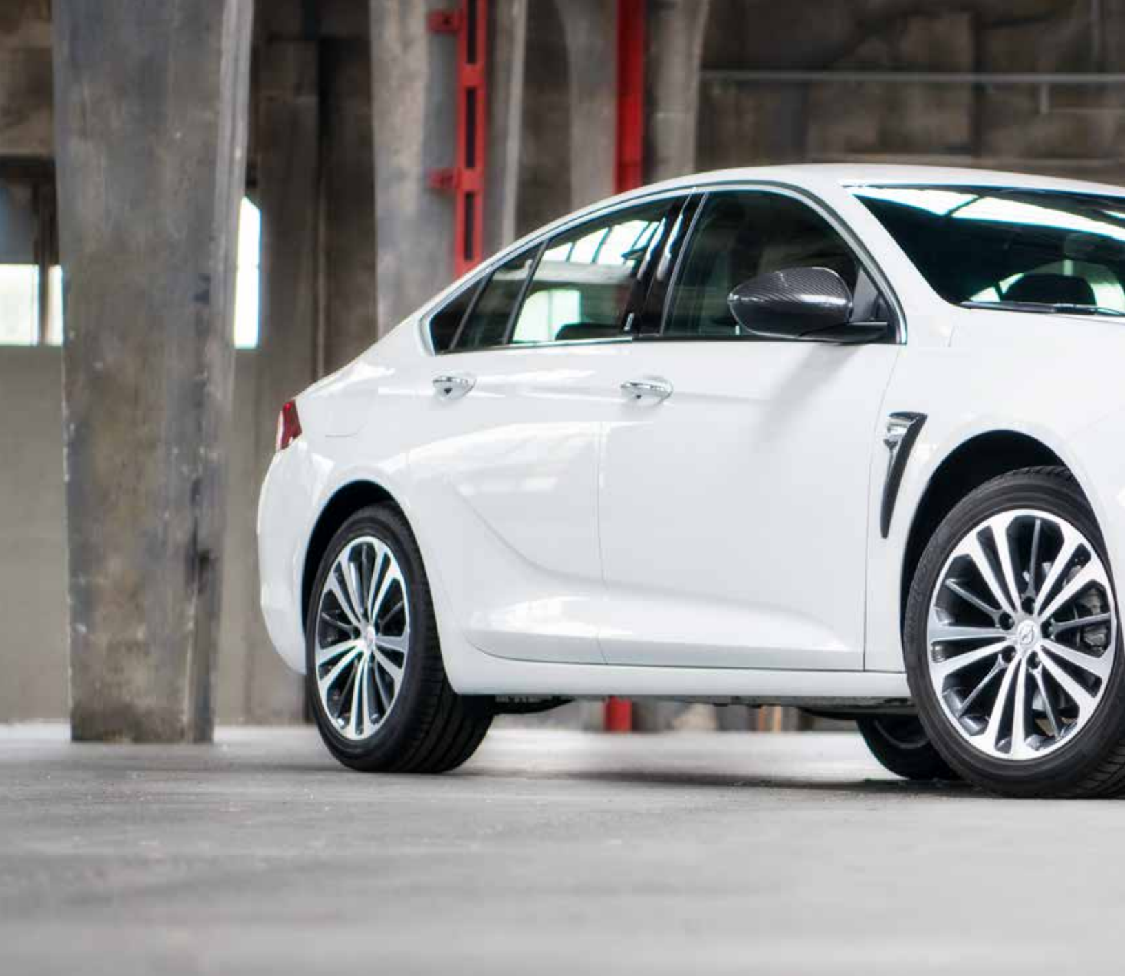
Opel Insignia Grand Sport - Edition Bitter