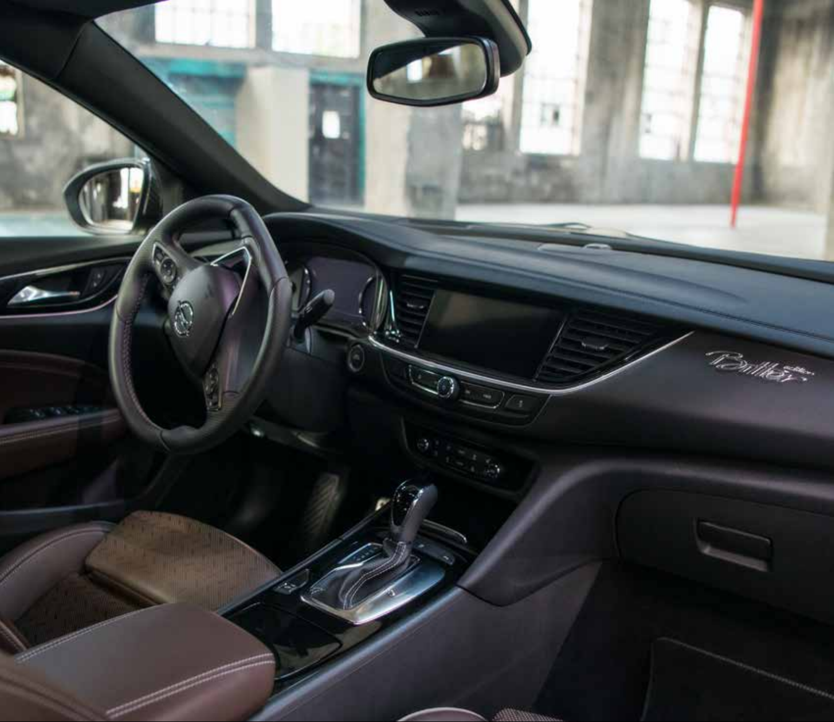
Opel Insignia Grand Sport - Edition Bitter