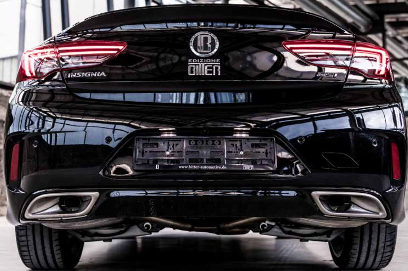
Opel Insignia GSi Grand Sport - Edition Bitter