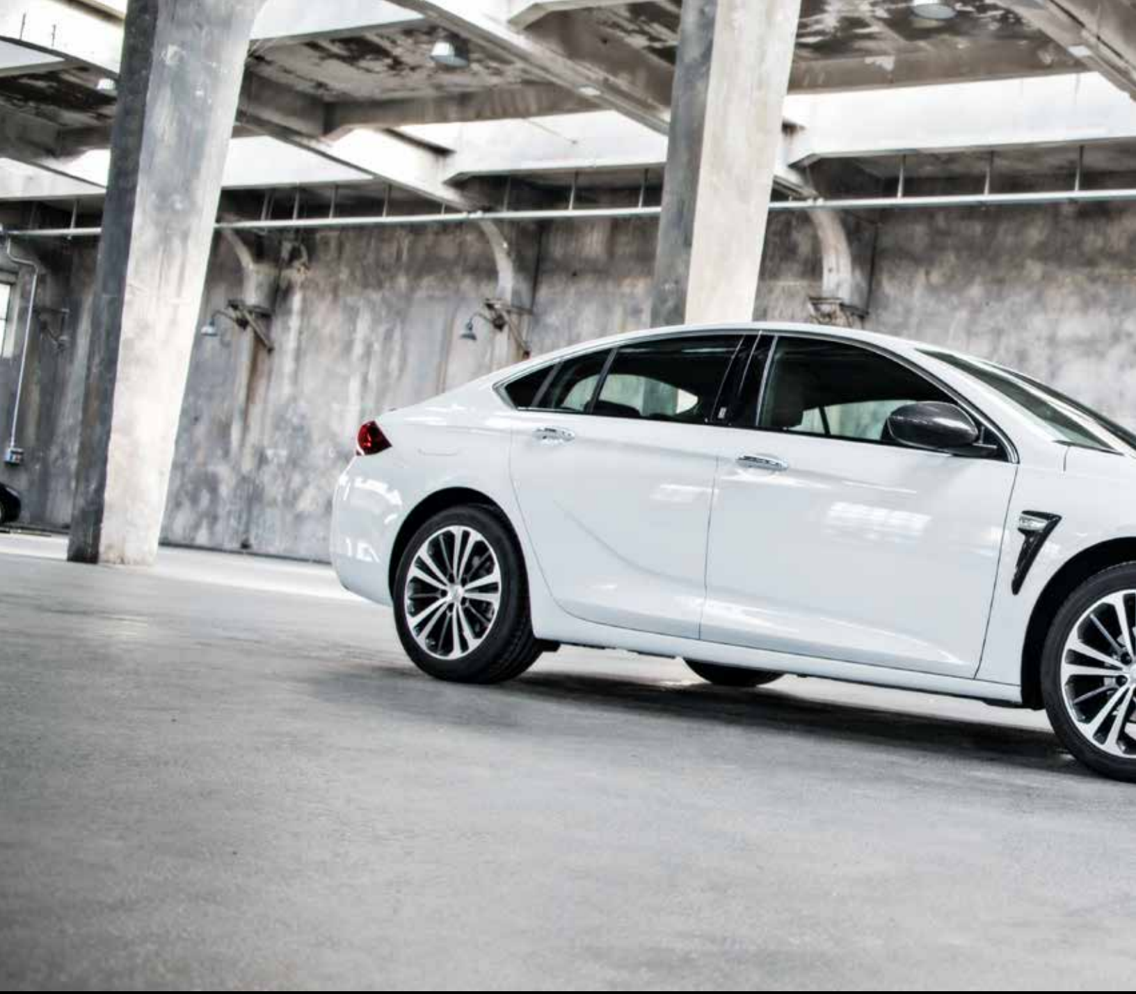
Opel Insignia Grand Sport - Edition Bitter