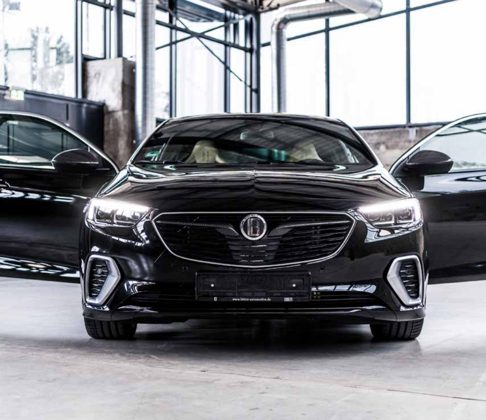
Opel Insignia GSi Grand Sport - Edition Bitter